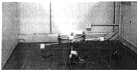
图 3-39 左飞